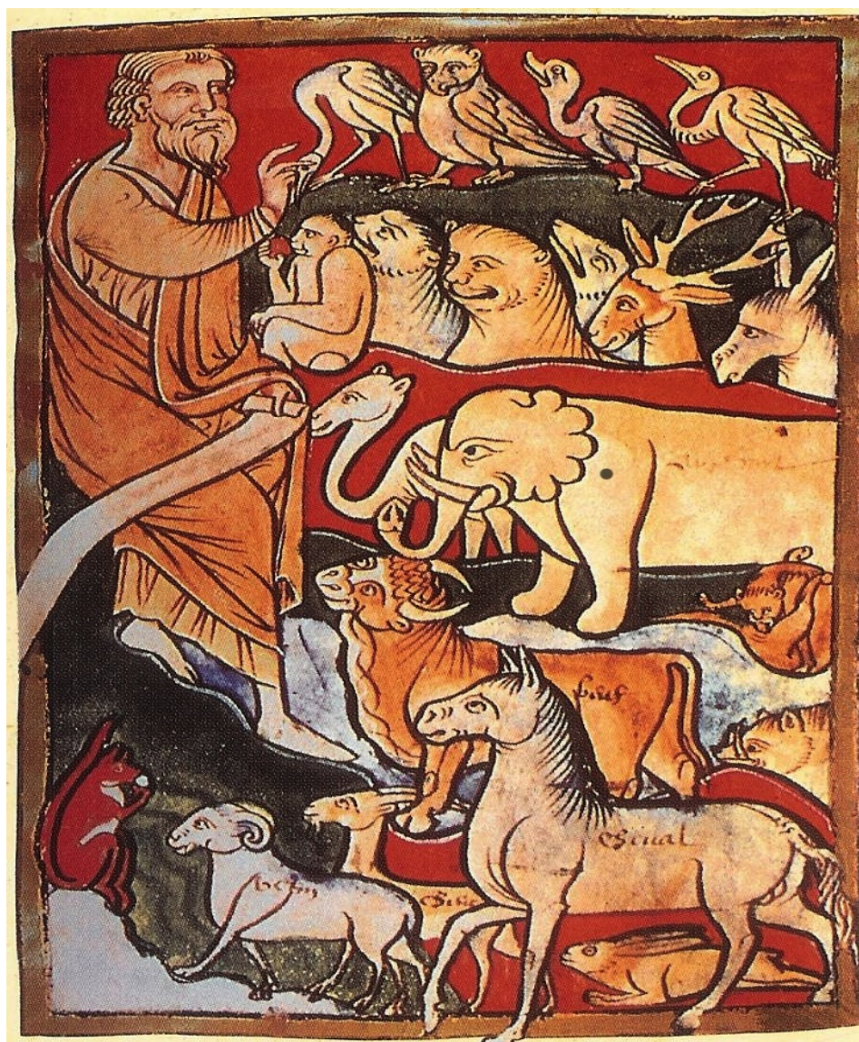
Adam donne son nom à chaque animal (XII siècle)

Source: Boris CYRULNIK, Si les lions pouvaient parler , Paris, 1998, pp. 1095-1103.