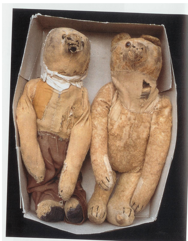
Cimetières d'ours: deux ours en peluche (1965)