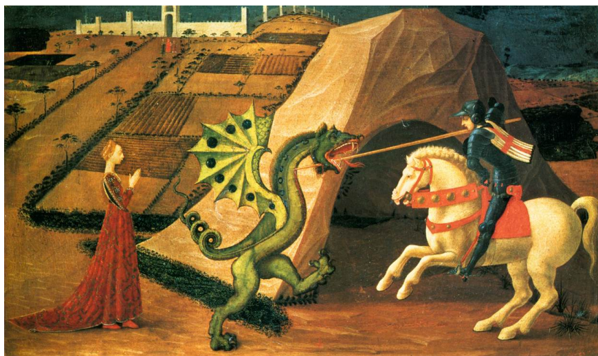
Paolo Uccello - Saint Georges et le dragon - 1458-60 (Paris)