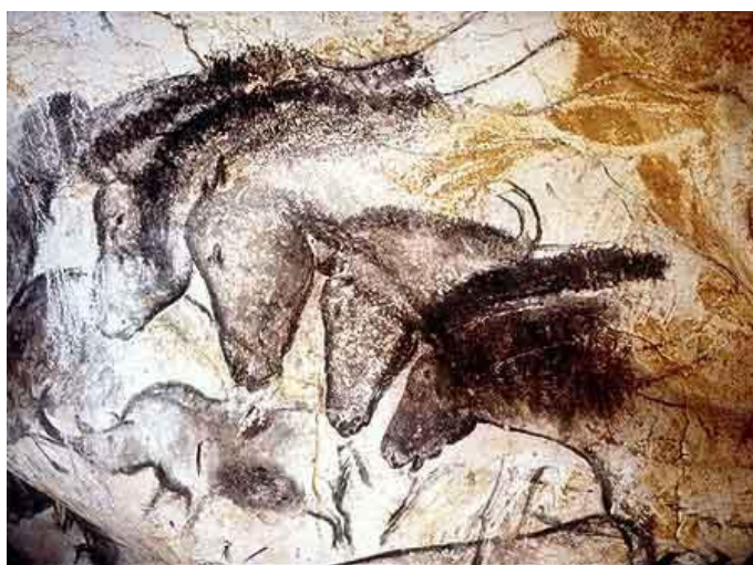
Chevaux - Grotte de Chauvet (-31'000)

Source: Robert DELORT, Les animaux ont une histoire , Paris, 1984, pp. 101-102