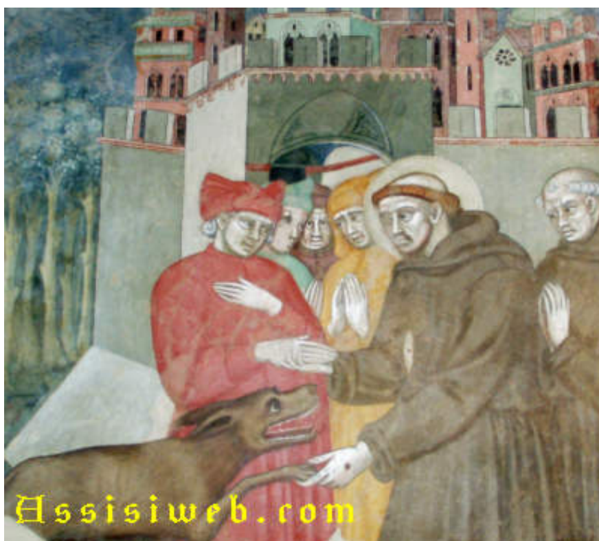
Binduccio Malabarba - San Francesco e il lupo di Gubbio Pienza. Chiesa di san Francesco (XIV secolo ?).

http://san-francesco.org/fioretti5_fra.html