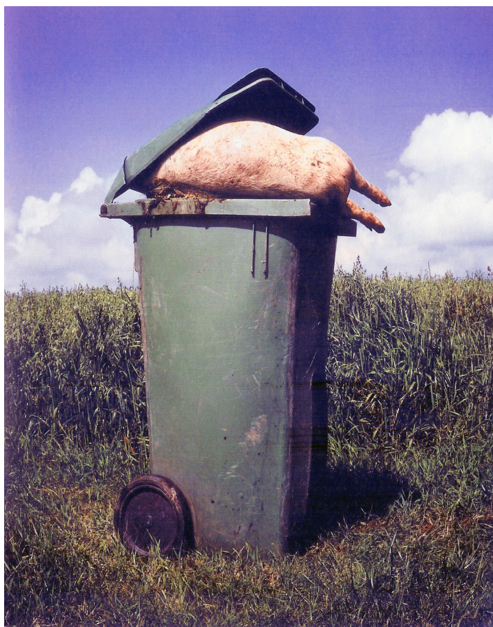
Cochon (Philippe Lopparelli - 2003)