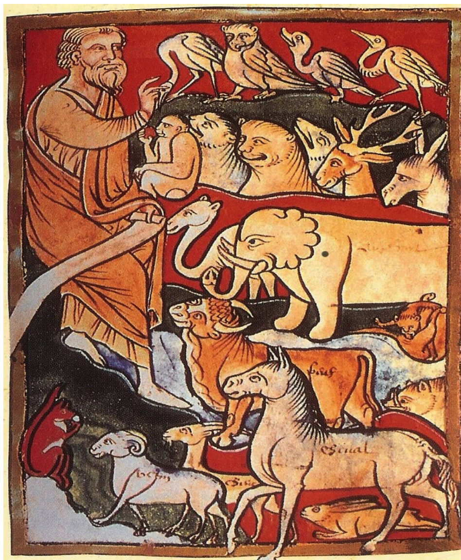
Adam donne son nom à chaque animal (XII siècle)

Source: Boris CYRULNIK, Si les lions pouvaient parler , Paris, 1998, pp. 1095-1103.